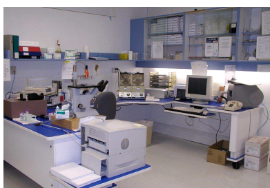
Poste de première génération réalisé à l'Hôpital de Gatineau